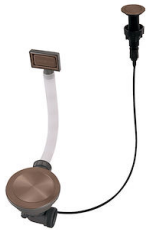
Desagüe automático Space Push Copper 8407 122